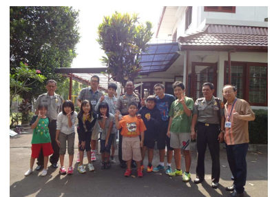
警備の確認に来てくださった警察の方と

(巡回に来てくださる私服警察の方の写真をBJC図書室に掲示しています、ご確認ください。)