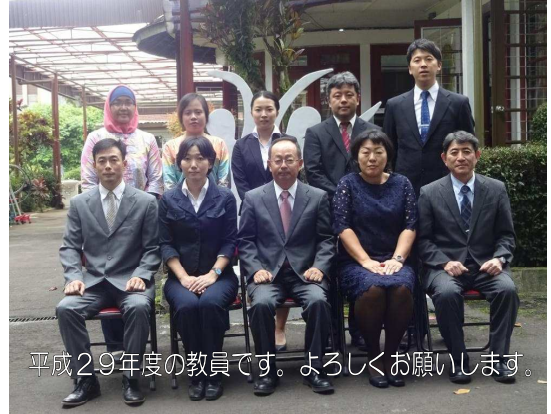
平成29年度の教員です。よろしくお願いします。

さて、今年度の重点は、「健康・体力」「感性」「国際性」への取り組みです。特に昨年との違いである「健康・体力」については、朝や放課後の活動などを利用して継続的に進めます。また、学校の警備強化にも取り組みます。安全・安心は学校の基本ですので、本校の温かくオープンな校風を残しながらも、より確かなものにしていきたいと思ひます。1年間、どうぞよろしくお願い致します。