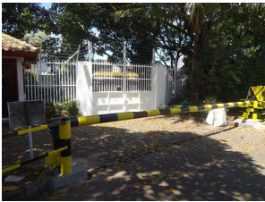
強化された正門付近