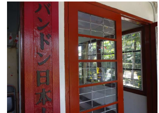
ガラスに貼られた飛散防止フィルム